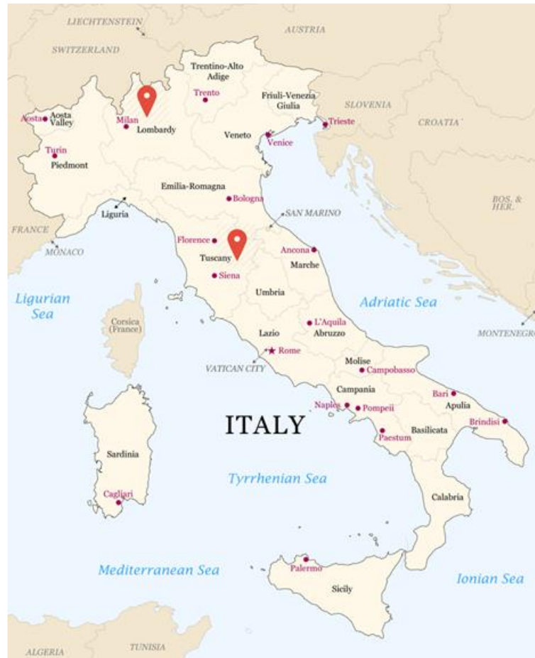
Figura 1: Ubicazione dei siti produttivi della CA