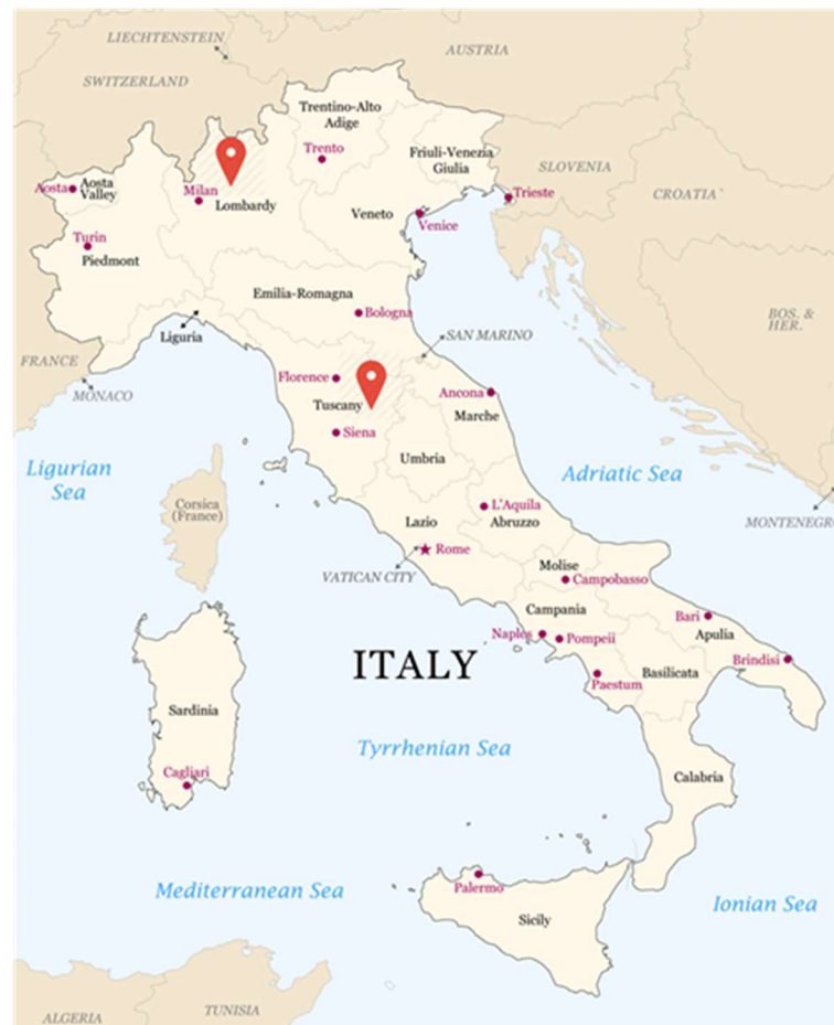
Figura 1: Ubicazione dei siti produttivi della CA

Nella seguente figura si mostra la collocazione geografica dei tre siti. Il sito "IT3" (disaster recovery) di Ponte S. Pietro (BG), nei pressi di Milano, dista circa 300 km dai siti primario e secondario in Arezzo: